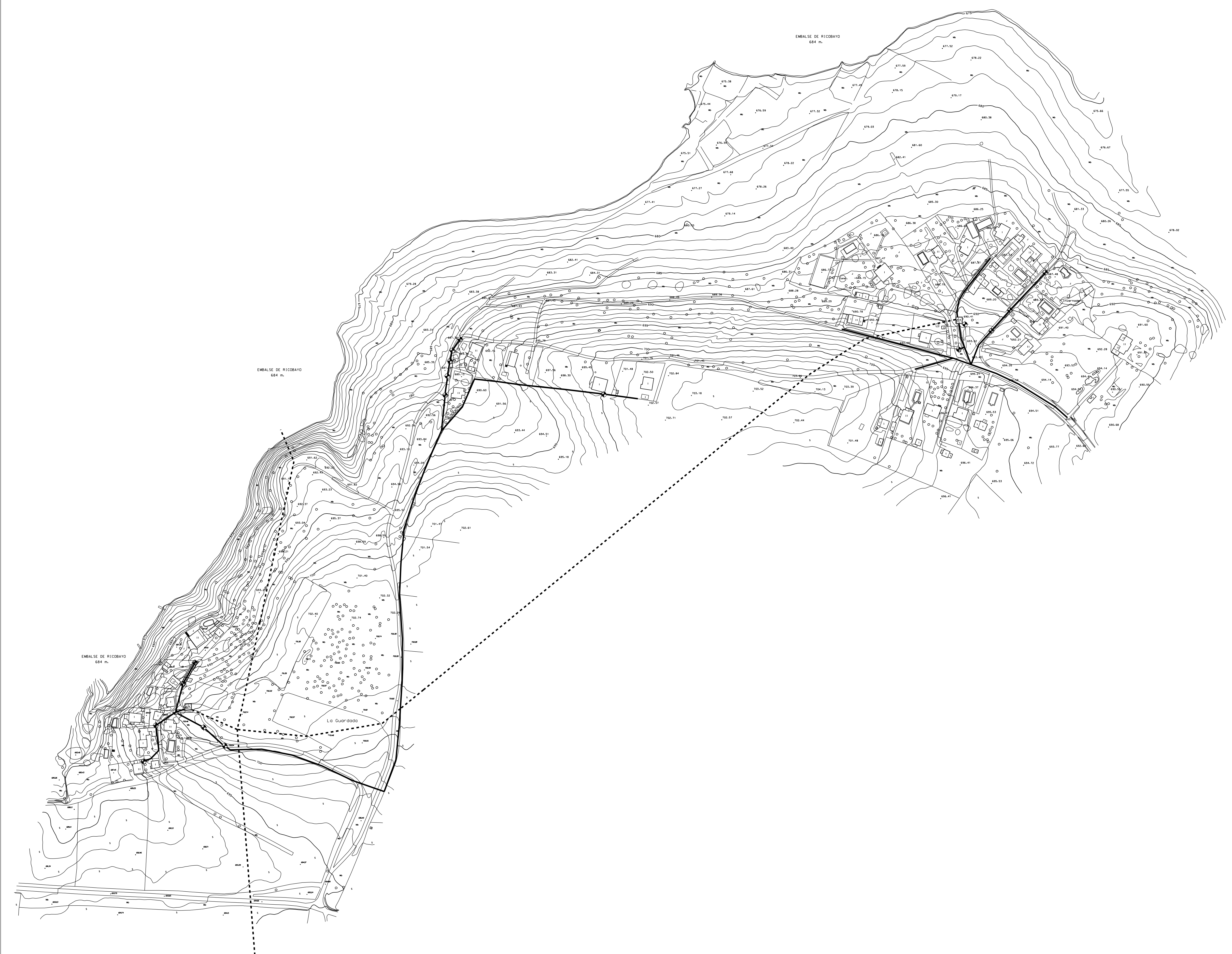
URBANIZACION EN EL PARAJE DE SAN CLEMENTE